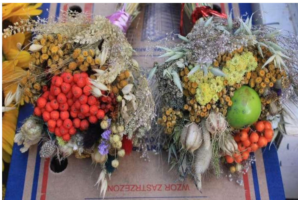
Fig. 3. Zdjęcie przedstawia wybrane bukiety układane z ziół i kwiatów, święcone w dniu Matki Boskiej Zielnej, w których zidentyfikowano: Achillea millefolium (Krwawnik pospolity), Avena sativa (Owies pospolity), Eryngium planum (Mikołajek płaskolistny), Gypsophila paniculata (Łyszczec wiechowaty), Helichrysum arenarium (Kocanki piaskowe), Limonium sinuatum (Zatrwian wrębny), Linum usitatissimum (Len zwyczajny), Lagurus ovatus (Dmuszek jajowaty), Lepidium densiflorum (Pieprzyca gęstokwiatowa), Malus domestica (Jabłoń domowa), Nigella damascena (Czarnuszka damasceńska), Papaver rhoeas (Mak polny), Phleum pratense (Tymotka łąkowa), Setaria viridis (Włośnica zielona), Sorbus aucuparia (Jarzab pospolity), Tanacetum vulgare (Wrotycz pospolity), Thlaspi arvense (Tobołki polne).

targu. W masowej sprzedaży, bo prawie na wszystkich stoiskach, znajdował się pasożytniczy gatunek – Viscum album (Figura 4.). Jego ulistnione i owocujące w tym czasie pędy, są tradycyjnie zawieszane w domach pod sufitem. Jest to zwyczaj obcego pochodzenia, wywodzący się z krajów nordyckich. Obecny w tradycji wsi polskiej na pewno po II Wojnie Światowej (Paluch 1988), natomiast nieopisany w tradycji obrzędowej z Wielkopolski i Kujaw przez Szulczewskiego (1933). Jemiola należała do roślin wykorzystywanych leczniczo, zanotowanych przez Szulczewskiego. Herbatki z jej pędów zalecano na zwapnienie tętnic i jako środek odchudzający.