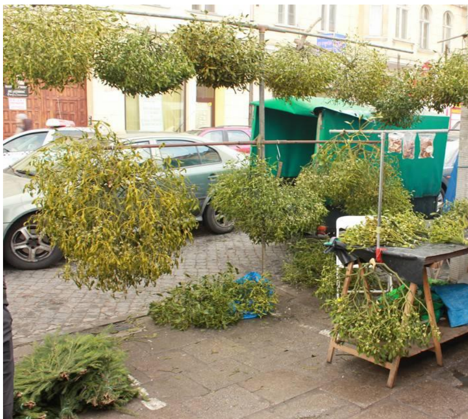
Fig. 4. Zdjęcie prezentujące ekspozycję Viscum album (jemiolo pospolita) przed Bozym Narodzeniem.