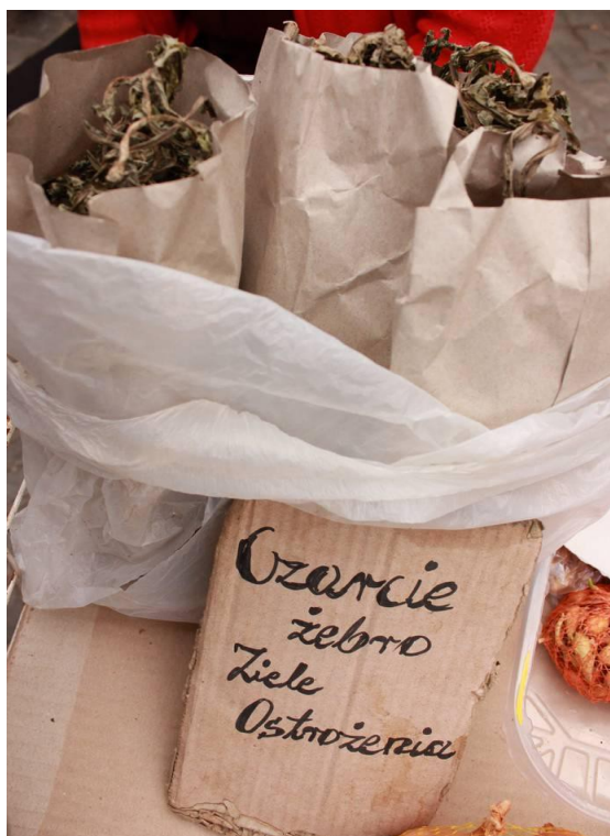
Fig. 5. Cieszący się nadal dużą popularnością, wykorzystywany w praktykach magicznych, Cirsium oleraceum (ostrożeń warzywny) nazywany powszechnie „czarcim zębem”.