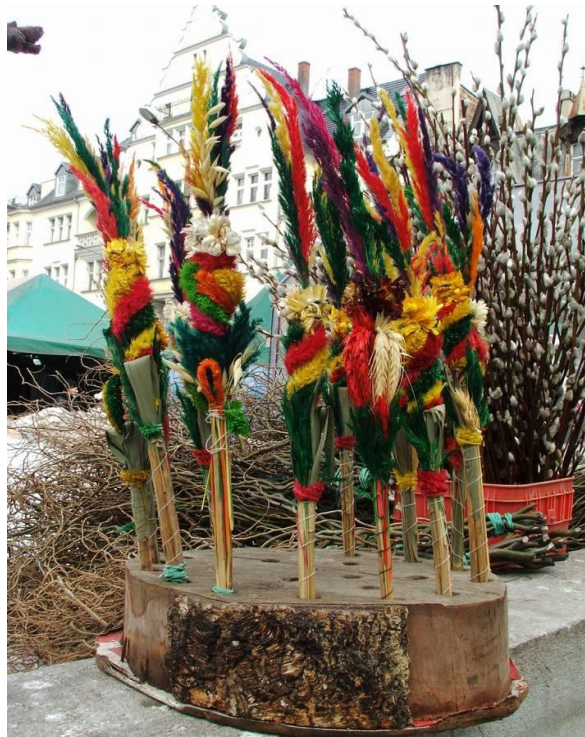
Fig. 2. Sprzedaż palm wielkanocnych, zarówno gałązek wierzby Salix sp. (na drugim planie) jak i barwnych palemek układanych z: Avena sativa (Owies zwyczajny), Calamagrostis epigejos (Trzcinnik piaskowy), Helichrysum bracteatum (Kocanki ogrodowe), Phleum pratense (Tymotka łąkowa), Phragmites australis (Trzcina pospolita), Secale cereale (Żyto zwyczajne), Setaria viridis (Włośnica zielona).

Nadal stosunkowo żywy jest zwyczaj święcenia ziół w sierpniowe katolickie święto Matki Boskiej Zielnej. W związku z tym, w ciągu całego tygodnia poprzedzającego uroczystość, „siadarki” wystawiają na sprzedaż, układane własnoręcznie, specjalne na tę okazję bukiety (Figura 3.). Zanotowano pojawienie się w bukietach 28 gatunków roślin, wśród których znalazły się rośliny dziko rosnące (np. Hypericum perforatum , Echium vulgare , Eryngium planum , Helichrysum arenarium , Lepidium densiflorum ), uprawiane w przydomowych ogrodach na tzw. „suszki” (np. Helichrysum bracteatum , Nigella damascena , Gypsophila paniculata ), zboża, natomiast rzadziej żywe kwiaty ogrodowe (np. Callistephus chinensis ) czy owoce ( Malus domestica i Rosa canina ). W bukietach święconych na Zielną wystąpiło pięć gatunków Szulczewskiego: Achillea millefolium , Helichrysum arenarium , Hypericum perforatum , Tanacetum vulgare i Thlaspi arvense . Bukiety te, cieszyły się znacznym zainteresowaniem wśród odwiedzających targ. W ciągu dnia, jedna siadarka była w stanie sprzedać kilkanaście wiązanek. Zależnie od finezji twórczyni, niektóre bukiety były uboższe gatunkowo (np. układane z 5 gatunków), w innych znaleźć można było nawet kilkanaście roślin. Tradycyjnie, bukiety zanoszone są następnie do kościoła i święcone przez księdza.